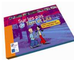
Sur les Pas de Tom et Lila Cycle 2