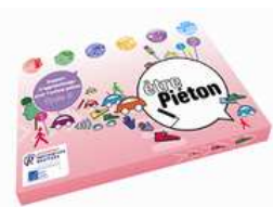
Etre Piéton Cycle 3

Mais les enseignants ne sont pas le seul public visé par les associations Prévention Routière et Assureurs Prévention. Les parents ont également un rôle primordial à jouer dans l'éducation routière des plus jeunes. C'est pourquoi elles ont créé en 2006 le site priorite-vos-enfants.fr , sur lequel les parents pouvaient trouver des conseils pratiques pour éduquer leurs enfants à la route, mais aussi des avis d'experts, des jeux pour les petits... L'ensemble de ses contenus a aujourd'hui été intégré sur les sites preventionroutiere.asso.fr (rubrique "Parents") et assureurs-prevention.fr .